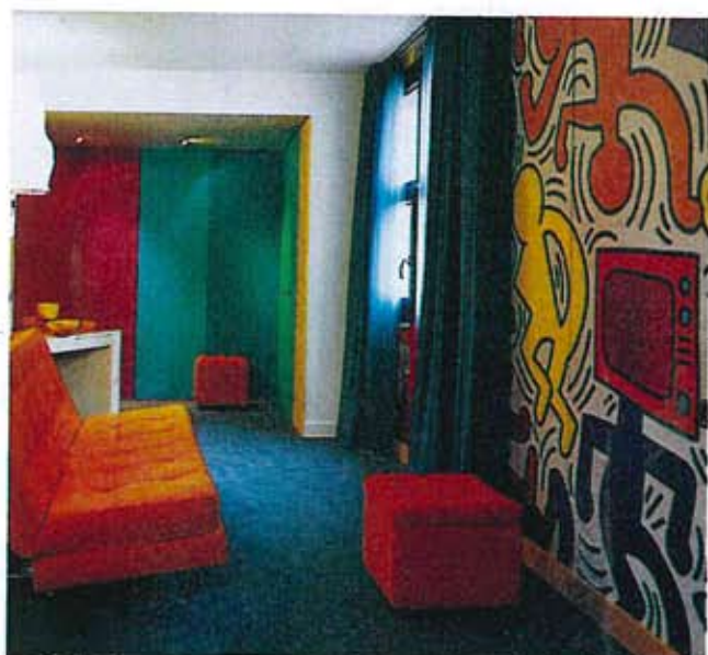
figura il fuoco, l'altra l'acqua – separa la hall dalla zona bar.

SOTTO: scorcio della suite Keith Haring. A destra, riproduzione di un'opera dell'artista americano a cui Benedetti si è ispirato nel disegnare il divano e i pouf in velluto arancione.